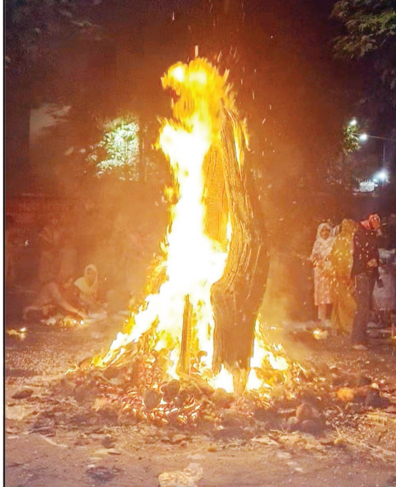
ગઈકાલે હોળી નિમિત્તે સુરત ઠેર ઠેર હોળીકાનું દહન કરવામાં આવ્યું હતું. ધાર્મિક પરંપરા મુજબ પૂન-વિધિ બાદ હોળી પ્રગટાવવામાં આવી હતી અને અને લોકોએ હોળીમાં શ્રીફળ સહિતની સામગ્રી હોળી હોળીકાના દર્શન કર્યા હતા.