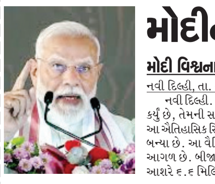
અનુસંદાન પાના ૭ પર

આધારિત છે. દુબઈ અને કાહિરા જેવા શહેર પૃથ્વીના 'સબ ટ્રોપિકલ હાર્ડ-પ્રેસર બેલ્ટ'માં આવેલા છે. આ વિસ્તાર ભૂમધ્ય રેખા પાસે હોવાના કારણે સૂર્યના કિરણો અહીં લગભગ સીધા પડે છે, જેથી સૂર્યપ્રકાશ અને ગરમી બંને વધુ હોય છે. આ વિસ્તારોમાં વાદળો ઘણા ઓછા બને છે. વાદળોની ગેરહાજરીમાં સૂર્યના કિરણોને રોકનાર કોઈ નથી હોતું, જેથી વર્ષના ૩૬૫ દિવસોમાં મોટાભાગના દિવસોમાં આકાશ સાફ અને ચમકદાર રહે છે, દુબઈમાં ગરમીનો પારો ઉત્થીટપ ડિઝી સેલ્સીયસ વચ્ચે રહે છે.