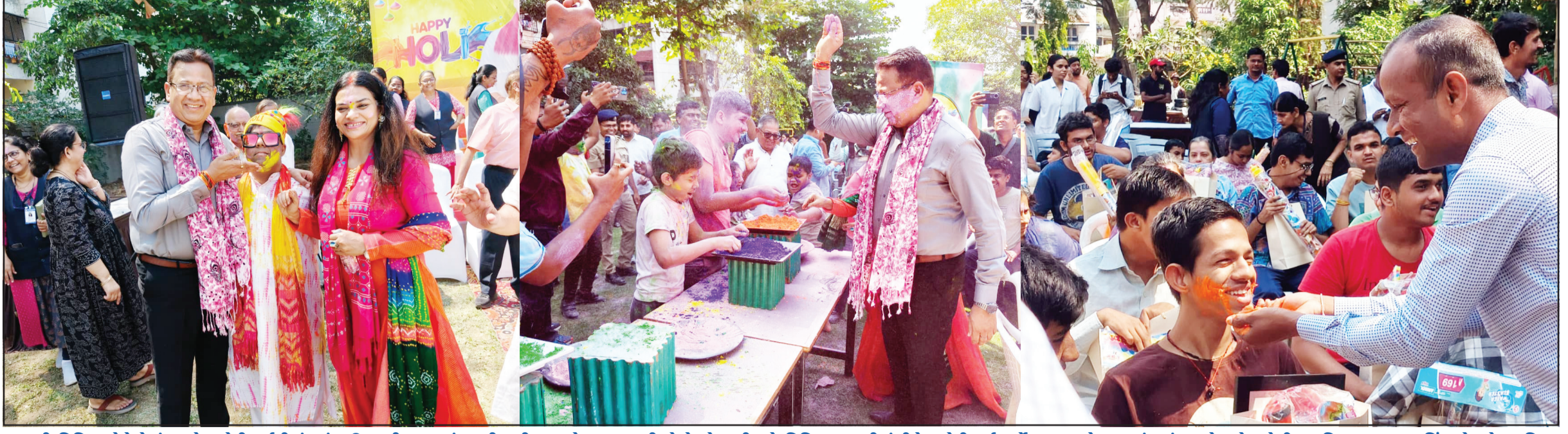
સુરતની વિવિધ કોલેજોમાં આજે ઘૂલોટી પર્વની રંગારંગ ઉજવણી કરવામાં આવી હતી. ચુપકો તથા ચુપતીઓએ એક બીજાને વિવિધ કલરથી રંગીને ઘૂલોટી પર્વ હર્ષોલ્લાસ સાથે મનાવ્યું હતું જ્યારે શહેર પોલીસ કમિશનર અનુમપસિંહ ગોહલોત પરિવાર સાથે અડાજણ ખાતેના જીવન વિકાસ ટ્રસ્ટના હોળીનો તહેવાર મનાવવા પહોંચ્યા હતા. પો.કમિ. અનુપસિંહ ગોહલોત એ દિવ્યાંગ બાળકો સાથે રંગ પર્વની ઉત્સાહપૂર્વક ઉજવણી કરી હતી.