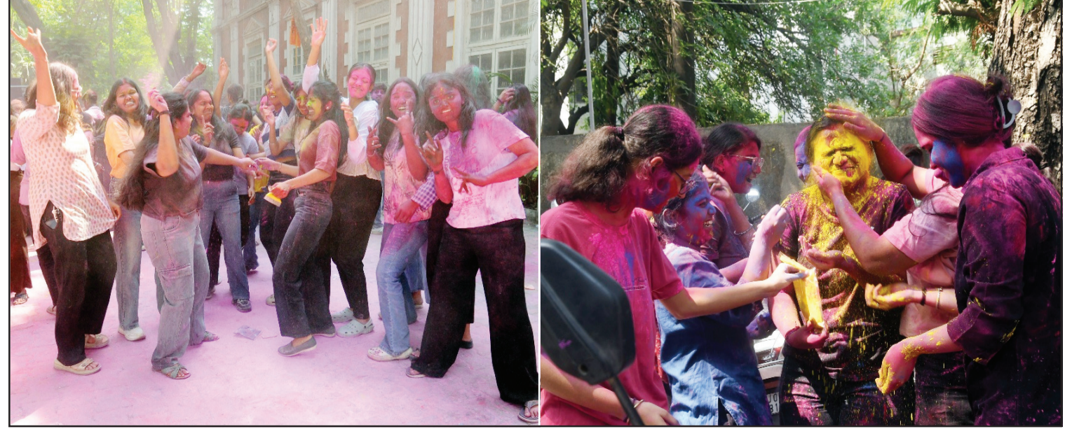
ફાગણ સુદ પૂનમે ચંદ્રગ્રહણનો યોગ હોવાથી આવતીકાલે રંગપર્વ ઘૂલોટી પર્વ ઉજવાશે. દરમિયાન આજે સુરતની શાળાઓ-કોલેજોમાં વિદ્યાર્થીઓ દ્વારા ઉલ્લાસપૂર્વક રંગપર્વ ઘૂલોટીની ઉજવણી કરવામાં આવી હોવાનું તસ્વીરમાં નજરે પડે છે.